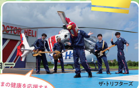
ザ・トリフターズ